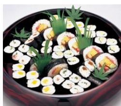
通夜料理 75名 様対応分

各祭壇に下記項目が共通して含まれます。人数の超過が無ければ追加料金はありません。